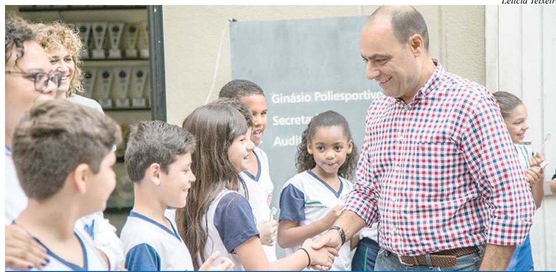
Prefeito acompanhou o primeiro atendimento da unidade

Os sorrisos dos alunos da rede municipal de São Caetano do Sul serão acompanhados mais de perto por dentistas. Como parte dos programas Saúde em Movimento e Saúde na Escola, a Prefeitura entregou a Unidade Móvel de Odontologia, que realiza atendimentos diários nas instituições de ensino da cidade. Os primeiros estudantes contemplados foram os da Emef (Escola Municipal de Ensino Fundamental) Leandro Klein, no Bairro Nova Gerty, nesta sexta-feira (12/4).