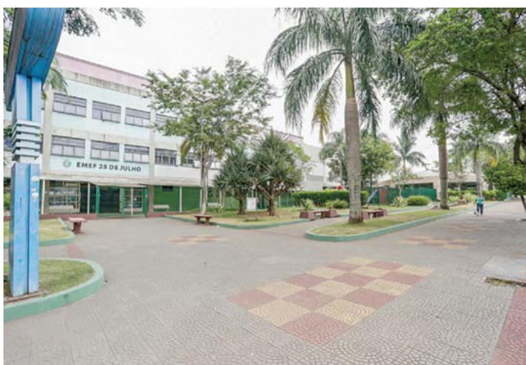
Vereador protocolou indicação em janeiro deste ano

De acordo com o texto, a unidade de ensino carecia urgentemente de uma completa revitalização para que suas instalações fossem readequadas às necessidades das crianças matriculadas. Além de reparos na cobertura do prédio, pintura e serviços gerais de manutenção, será feita a instalação da infraestrutura necessária (elétrica, hidráulica e rede de gás) para a inauguração do "Espaço Conexão", novo recurso pe-