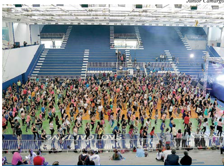
As aulas acontecem em centros esportivos, parques e CISEs