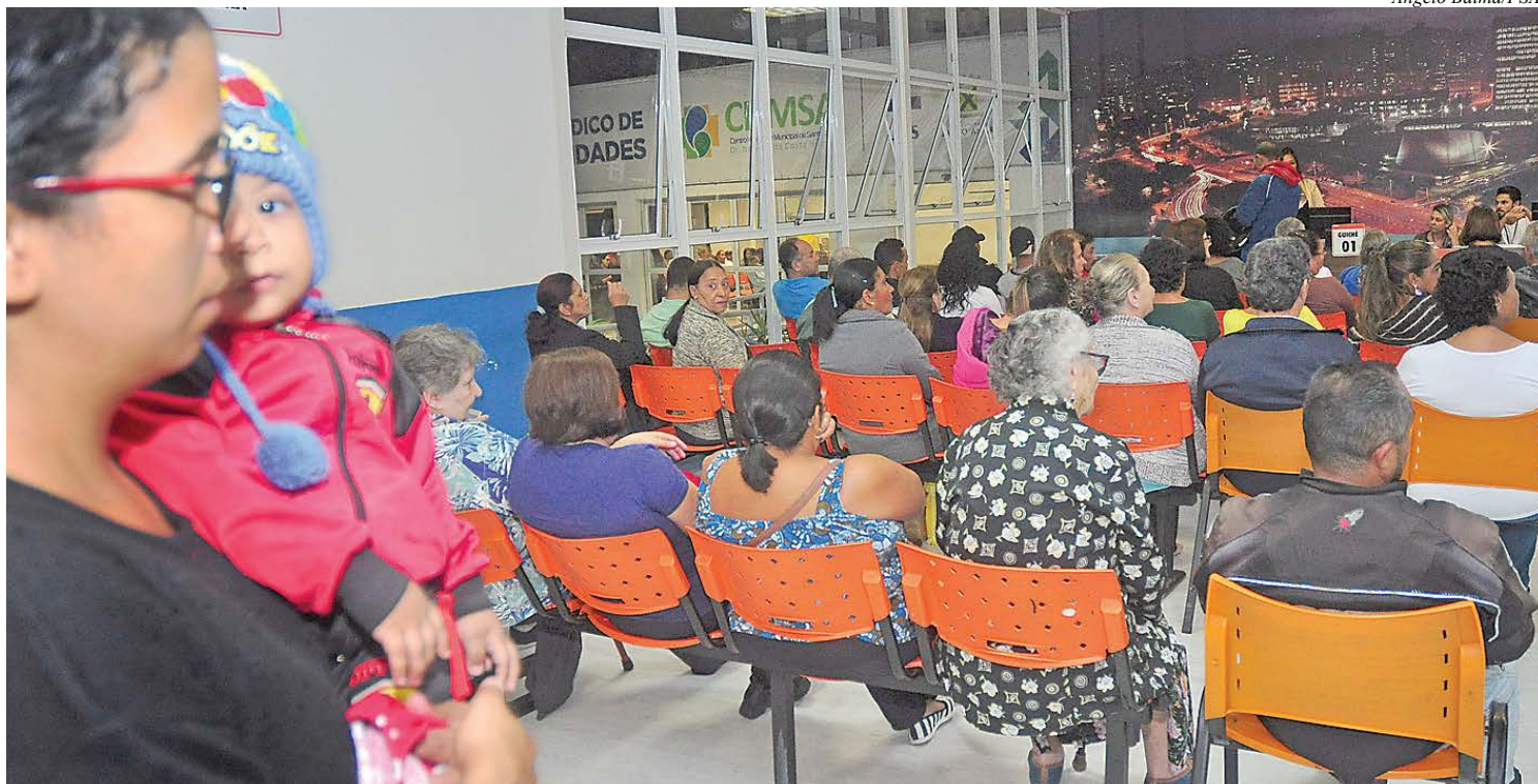
Consultas são realizadas no Centro Hospitalar Municipal

Para garantir efetividade e agilidade aos atendimentos, a organização desta força-tarefa foi dividida em três etapas. Após o primeiro atendimento, se necessário, os pacientes serão encaminhados para realizar exames de diagnóstico e retorno médico para efetivar a alta, ou serão direcionados à rede de atenção especializada