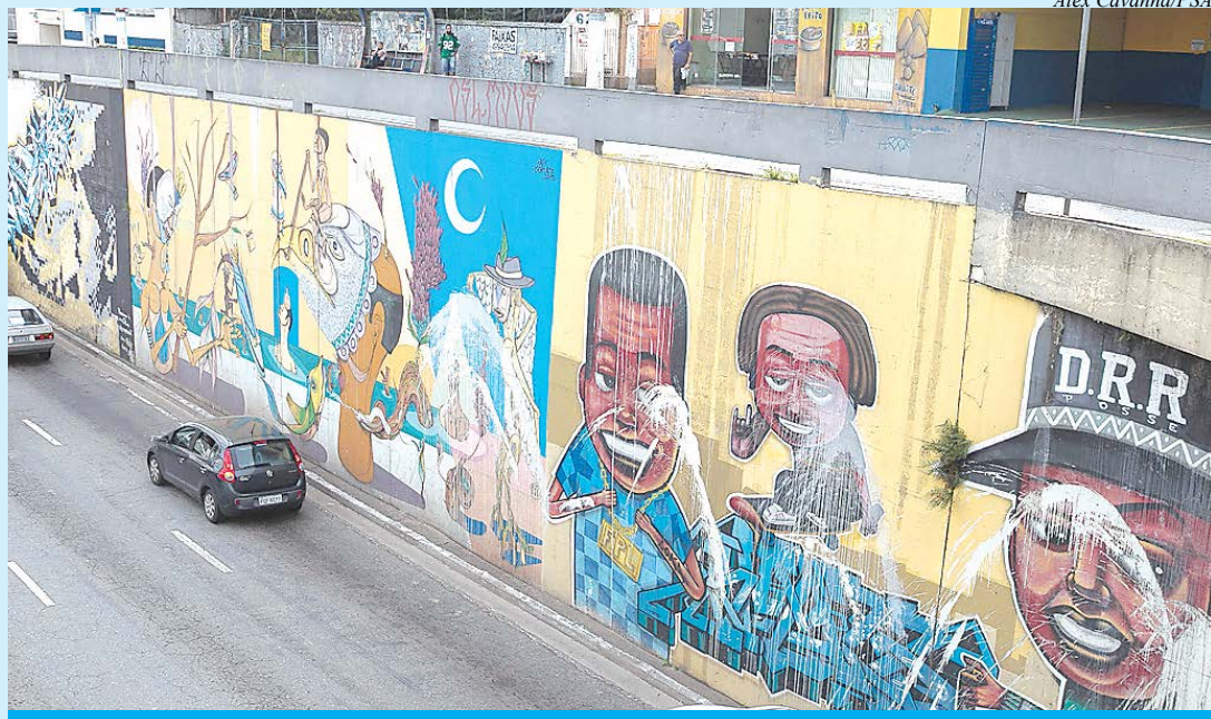
Projeto de renovação é na Avenida Santos Dumont

O cachê por projeto será de R$ 15.000,00 (quinze mil reais) e cada artista deverá custear sua produção, materiais, serviços, alimentação, deslocamento de equipe e outros. A área a ser grafitada tem mais de 2.600 metros quadrados. Os critérios de