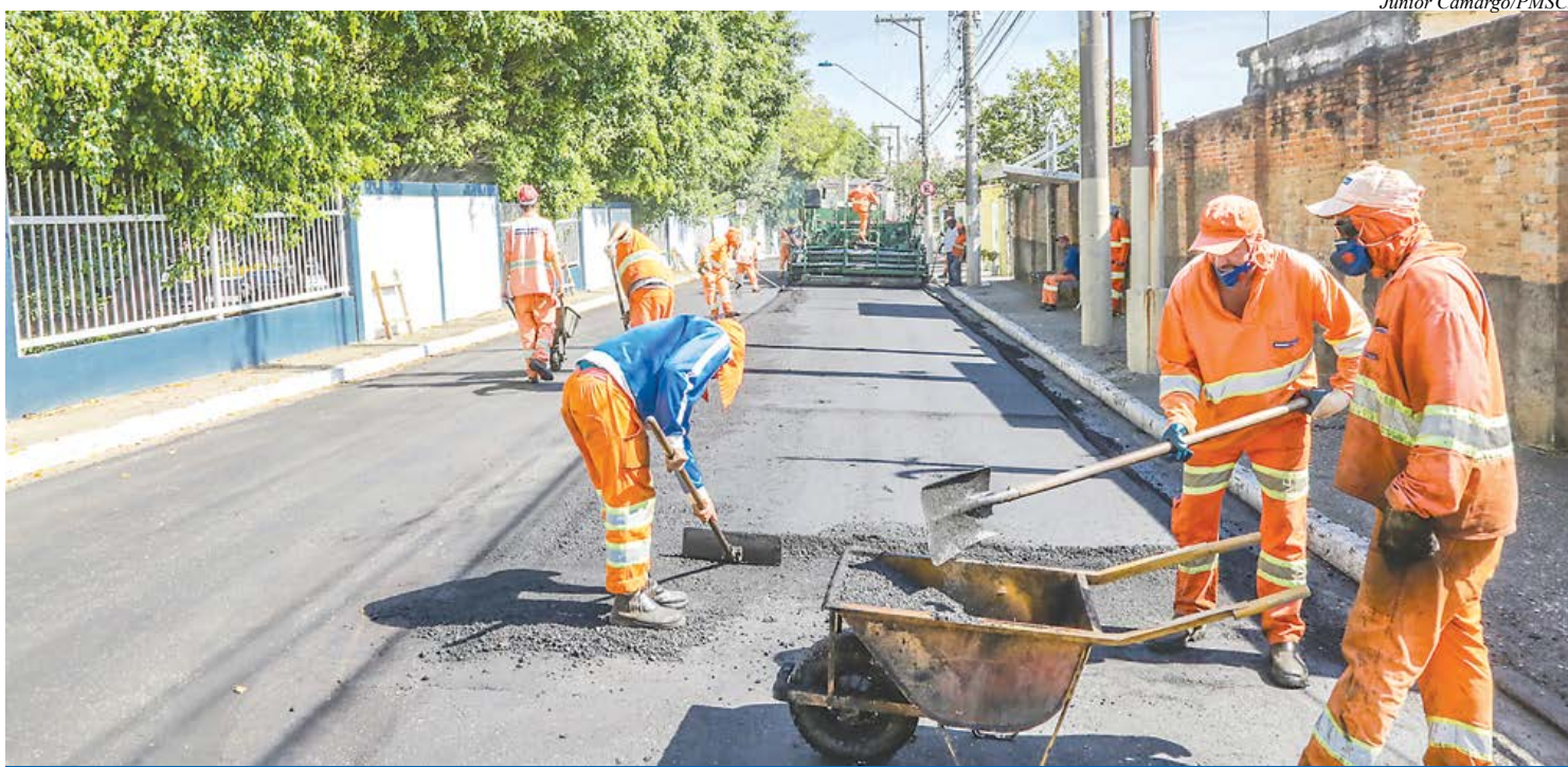
Funcionários trabalham no recapeamento da Rua Eduardo Prado

As obras de recapeamento tiveram início em junho de 2018, abrangendo parte das avenidas Guido Aliberti e