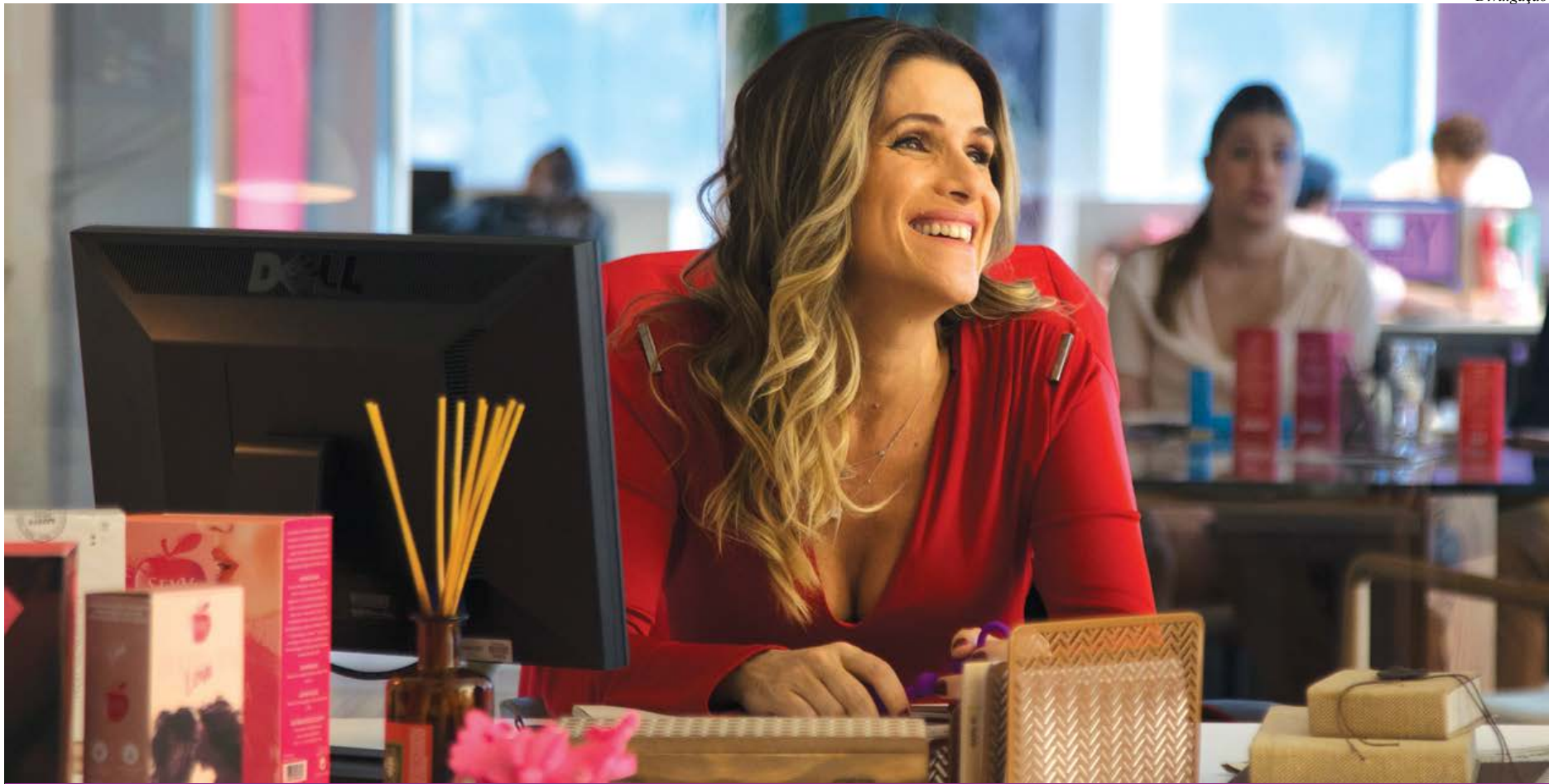
Ingrid Guimarães interpreta a empresária bem sucedida Alice