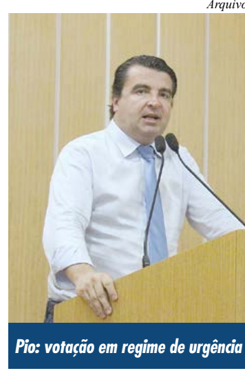
Pio: votação em regime de urgência

projetos como o fortalecimento e valorização da Associação de Pais e Mestres (APMs); que o Sistema de Água, Esgoto e Saneamento Ambiental (SAESA) e a Secretaria Municipal de Serviços Urbanos (SESURB) tenham uma equipe de manutenção e reparo para atender exclusivamente a área da Educação; que os diretores das escolas sejam escolhidos através de votação interna da comunidade escolar; além do Plano de Cargos e Salários dos Profissionais de Educação, concluiu.