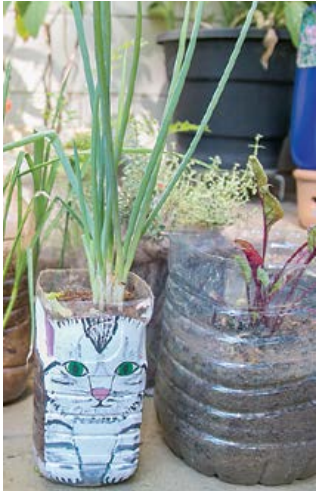
Oficina ensina plantar hortaliças

Quem mora em apartamento ou casa sem quintal não tem mais desculpa para deixar de fazer sua própria horta de verduras e temperos. Criatividade e consciência ambiental transformam materiais que seriam descartados - caixas de ovos e garrafas pet - em charmosos e divertidos vasinhos para uma pequena horta caseira.