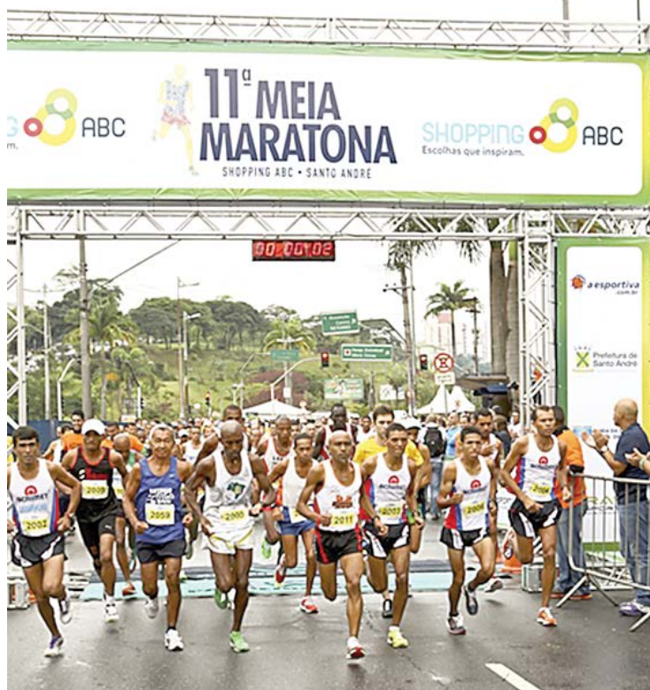
Evento tem caminhada de 5km e corrida de 10 e 21km

Competição integra festejos de aniversário