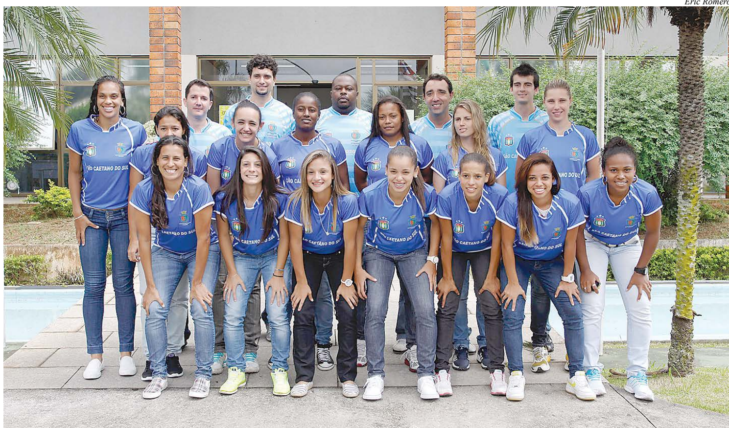
Equipe que defenderá São Caetano no futebol feminino foi apresentada no Palácio da Cerâmica