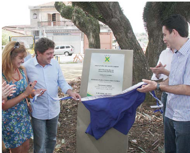
Autoridades municipais descerram a placa de inauguração

Santo André ganhou no sábado (6), mais uma opção de lazer, saúde e convivência social para seus moradores. Trata-se da Praça Heliópolis, localizada no encontro das Ruas Cubatão, Caconde, Cabreúva e Rubiãea, na Vila Lucinda, e que foi totalmente reformulada. As intervenções tiveram início em outubro e foram concluídas no início deste mês.