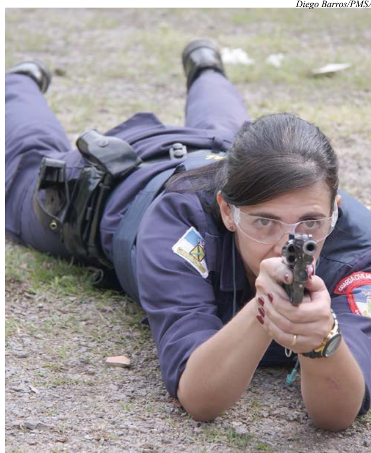
Guardas municipais de Santo André participam de aula prática de tiro