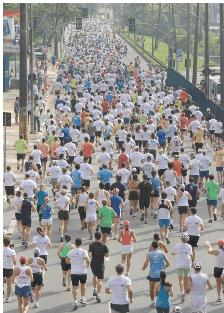
Tradicional evento reúne milhares de corredores em Santo André

interessados poderão se cadastrar no site do Shopping ABC ( www.shoppingabc.com.br ), ou na loja A Esportiva, localizada no piso P1 do empreendimento, até o dia 21 de abril. Página 8