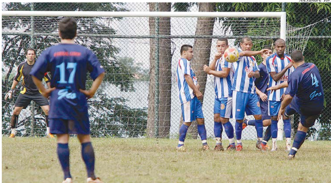
Partida entre Metalúrgicos e Alvi Celeste marcou o início das competições em São Caetano

A primeira rodada do Campeonato Municipal de Futebol Amador de São Caetano, disputada na manhã de domingo (7/4), foi marcada pelo equilíbrio entre as equipes. Das nove