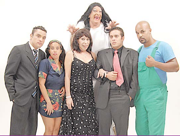
Uma comédia muito mais hilária do que uma simples piada de sogra

Os ingressos custam R$60 (inteira), R$30 (meia), R$25 (promocional para quem levar 1 kg de alimento) e R$10 (promocional para servidores públicos que levarem 1 kg de alimento). Estão à venda na bilheteria do teatro, das 14h às 19h. A duração do espetáculo é de 80 minutos.