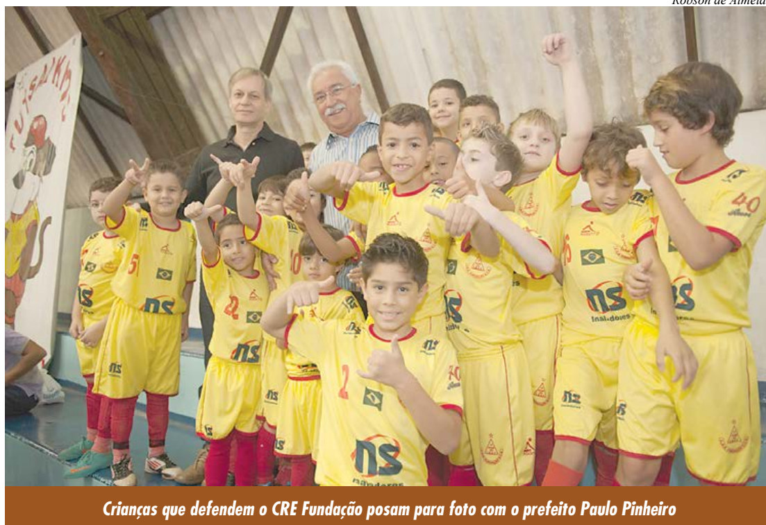
Crianças que defendem o CRE Fundação posam para foto com o prefeito Paulo Pinheiro

A maior goleada da rodada inaugural foi aplicada pelo Cespro sobre o Águias de Nova Gerty na categoria pré-mirim: 9 a 0.