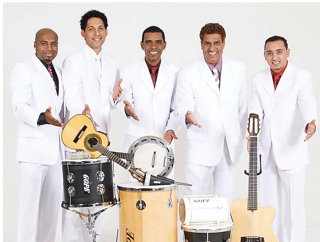
Show será no Espaço Verde Chico Mendes

Grupo vai abrir oficialmente as comemorações de aniversário