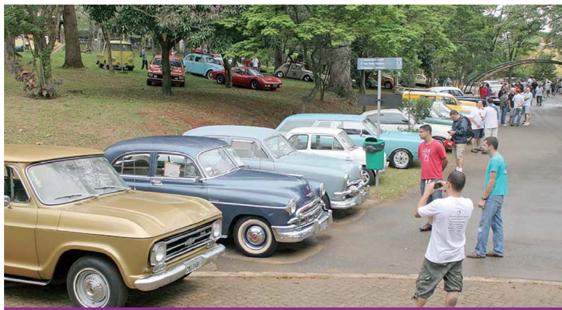
Edição de março reuniu mais de 80 veículos

Local terá praça de alimentação e comércio de materiais relacionados ao antigomobilismo