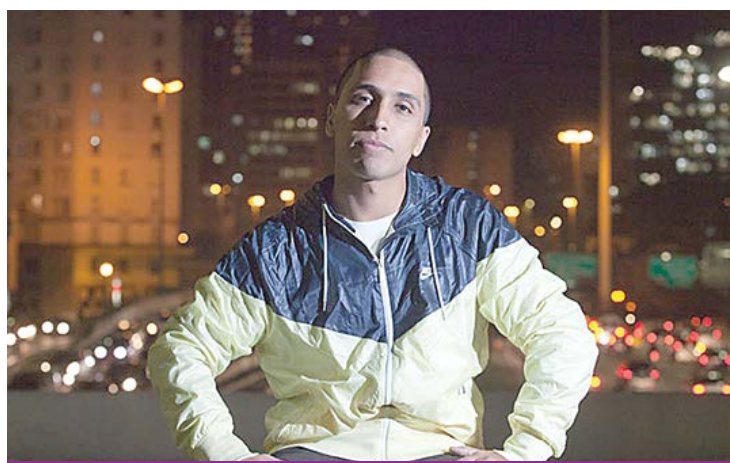
Rashid, um dos maiores talentos do rap brasileiro da atualidade

Evento terá Djs, grafite, break e basquete