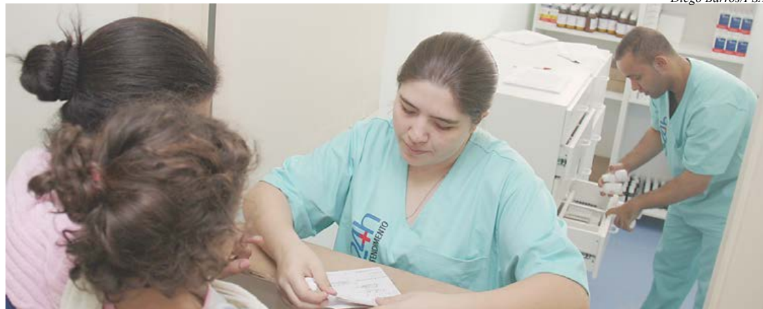
Para ser beneficiado, morador deve passar por consulta nos próprios postos

UPAs são dos bairros Centro, Sacadura Cabral e Jardim