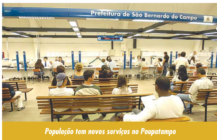
População tem novos serviços no Poupatempo

Novos serviços irão facilitar ainda mais a vida dos cidadãos da região