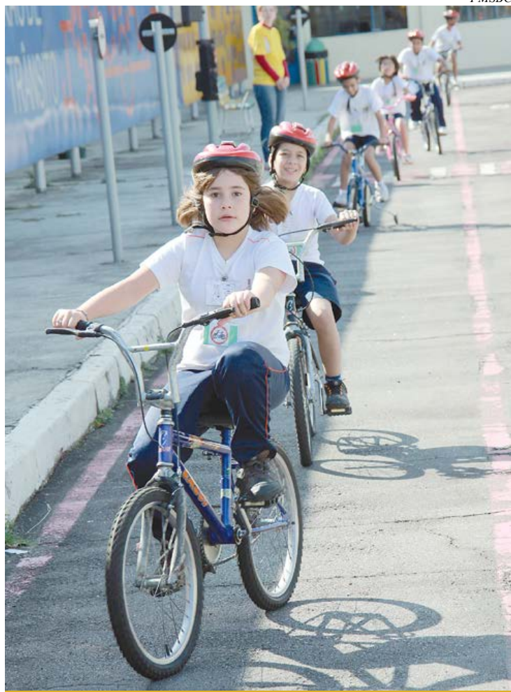
Alunos passam por experiências no trânsito no papel de ciclistas

Desde 2009, o Serviço de Educação para o Trânsito, que coordena o programa, já fez mais de 80 mil atendimentos, entre alunos das redes municipal, estadual e particular de ensino da cidade. Também são feitas palestras para empresas e universidades com o intuito de passar orientações e informações para uma melhor convivência no trânsito.