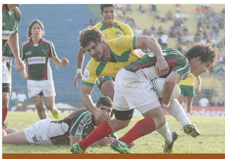
Partida foi disputada entre Brasil e México

Jogo levou mais de 3 mil pessoas ao estádio