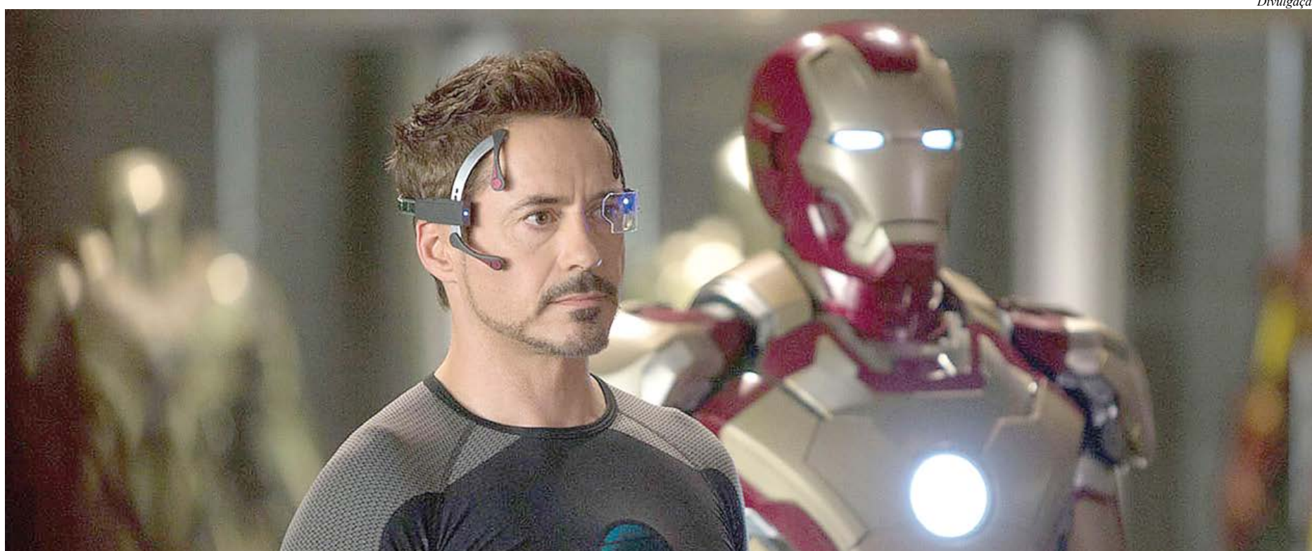
Grande parte do sucesso de Homem de Ferro pode ser creditada a Robert Downey Jr.

Filme da Marvel deve bater recorde de bilheteria com a terceira edição