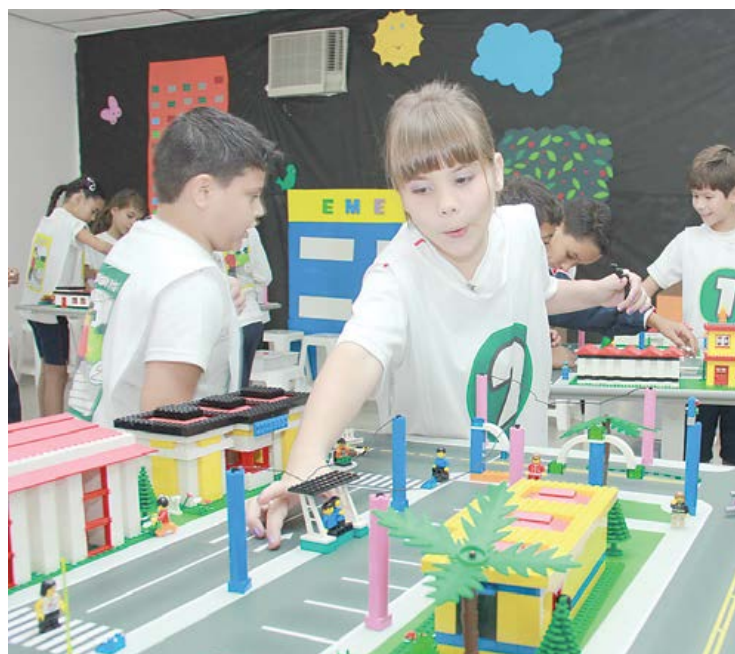
Alunos aprendem regras básicas, como sinalização de trânsito

Estimular a convivência mais pacífica e segura entre motoristas e pedestres é o objetivo do programa Mobilidade para a Cidadania. Desenvolvido pela Secretaria de Transportes e Vias Públicas de São Bernardo do Campo, ele prevê, entre outras ações, a realização de diversas atividades educativas no Centro de