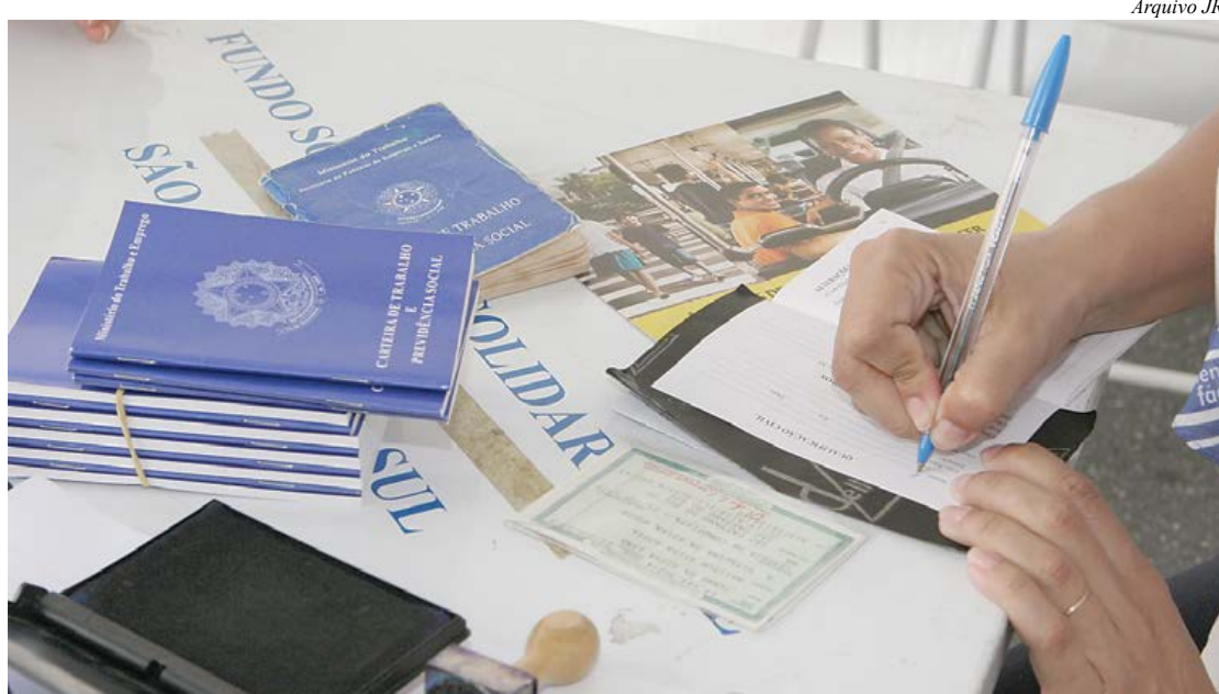
Em termos absolutos, o contingente de desempregados diminuiu em 12 mil pessoas