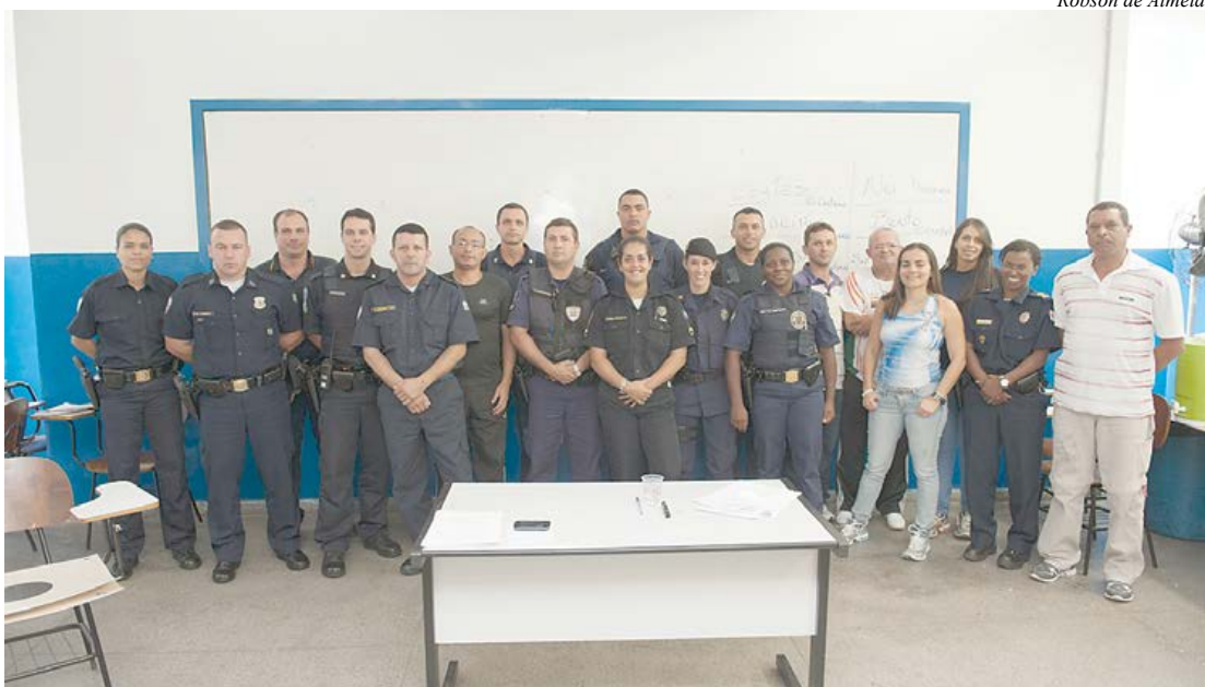
Competição vai reunir representantes de 30 corporações