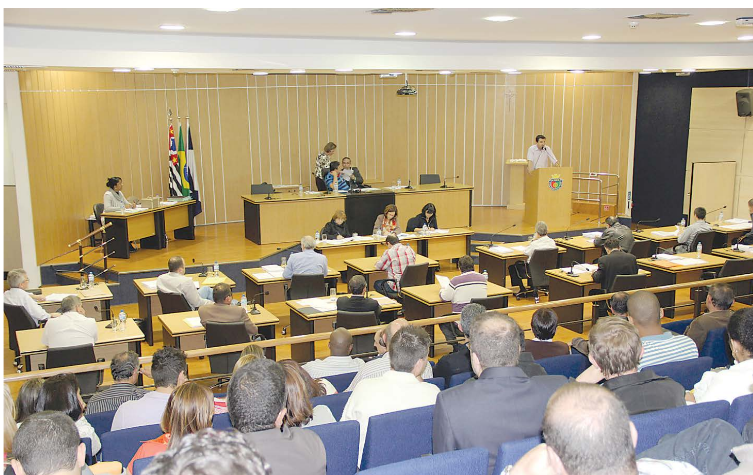
Vereadores aprovaram por unanimidade o aumento do benefício

jeito de lei do prefeito Paulo Pinheiro, que irá alterar a redação do caput do artigo 3º da Lei Número Nº 5055, de 16 de dezembro de 2011, que previa este repasse financeiro no valor de R$ 60 mensais no Cartão Alimento. Agora, basta Pinheiro sancionar a lei para que o aumento entre em vigor, o que deverá ocorrer já nos próximos dias. Página 4