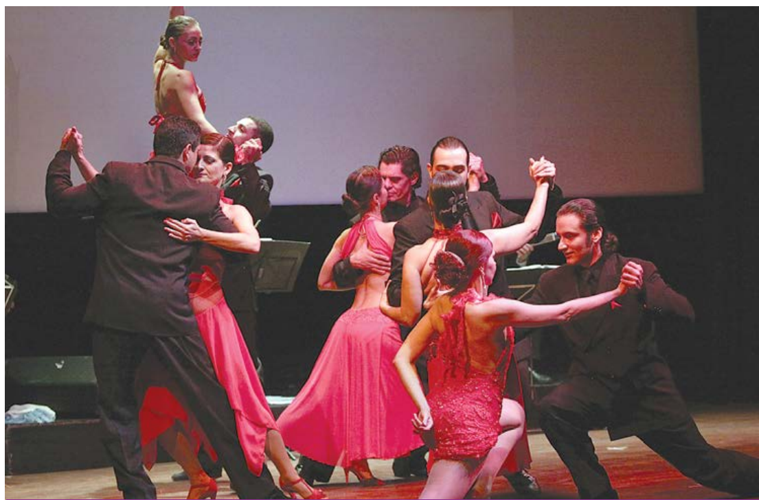
Apresentação de música e dança traz a sensualidade da tradição Argentina

Espetáculo é homenagem a Carlos Gardel e Astor Piazzolla