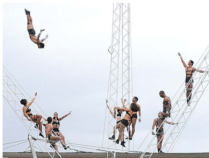
Picadeiro Aéreo conta de maneira poética a chegada dos circenses no Brasil

O SESC São Caetano, em parceria com a Secretaria Municipal de Cultura de São Caetano do Sul, traz no dia 28/04 (domingo) para o parque Chico Mendes (Avenida Fernando Simonsen, 566 – Bairro São José) o espetáculo "O Picadeiro Aéreo", às 19h.