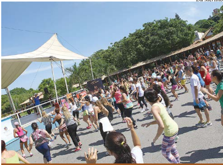
Esporte e Saúde leva atividades esportivas gratuitamente

O fim de semana será agitado em São Caetano do Sul. São diversas atividades que demonstram todo o cuidado e a atenção da Prefeitura com o morador da cidade.