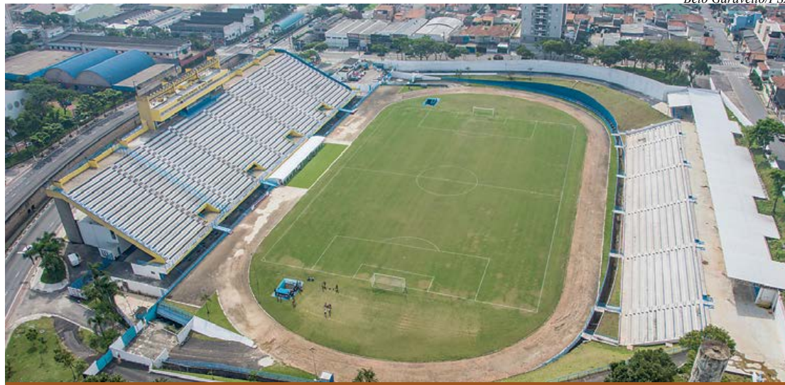
Recuperação do gramado do Bruno Daniel irá durar dois meses, segundo cronograma do COB

A partir do próximo dia 23, o gramado do Estádio Bruno José Daniel, em Santo André, começa a ser revitalizado pelo COB (Comitê Olímpico Brasileiro), em parceria com a Fifa. Uma empresa foi contratada para fazer a recuperação do campo, que será local de treinamento de seleções femininas e masculinas de futebol, ainda não definidas, dos Jogos Olímpicos do Rio de Janeiro, de 5 a 21 de agosto. Pelo cronograma do órgão, o trabalho terá duração de dois meses e será finalizado