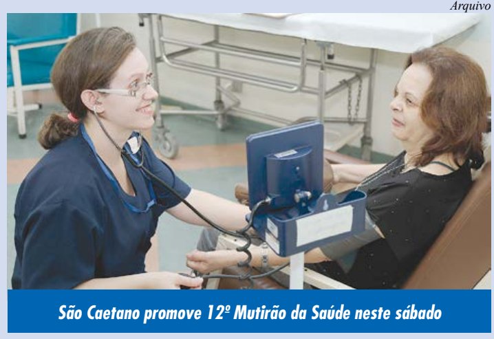
São Caetano promove 12º Mutirão da Saúde neste sábado

A ação global também disponibilizará gratuitamente aos pacientes da cidade os seguintes serviços: Aferições de pressão arterial e glicemia, Centro de Distribuição de Medicamentos (Obrigatório levar receita médica), Humanização (Grupo +QAlegria, formado por alunos de Medicina da USCS), Ouvidoria da Saúde e Transporte, inclusive para pessoas com deficiência (Para agendar, ligar para 0800-7719199).