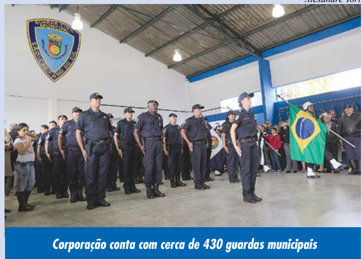
Corporação conta com cerca de 430 guardas municipais

No sábado (14/5), a Prefeitura entregou a revitalizada sede da Guarda, que está situada na Avenida Fernando Simonsen, 160, no Bairro Cerâmica. Na ocasião, a corporação recebeu armamento (200 pistolas, calibre 380) e novos uniformes.