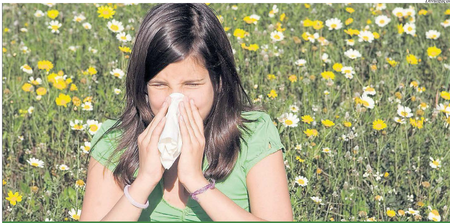
Rinite afeta aproximadamente 26% das crianças e 30% dos adolescentes

A asma e a rinite são as alergias mais comuns nesta época. No Brasil, cerca de