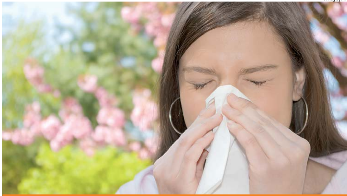
Crises alérgicas aumentam com a temperatura baixa

A nova estação ainda não chegou, mas os primeiros dias de maio já registraram temperaturas amenas em diversas regiões do país. O inverno, época detestada por quem sofre de alergia respiratória, só começa em 20 de junho, porém, segundo o site Climatempo, os próximos dias já terão cara da estação. Uma frente fria chegou ao país no dia 15, e o frio – grande irritante respiratório – continuará a ser sentido nos próximos dias de maio. É, portanto, hora de tirar aqueles casacos guardados no armário desde o último inverno, provavelmente impregnados de ácaros e poeira – grandes inimigos dos alérgicos. Página 4