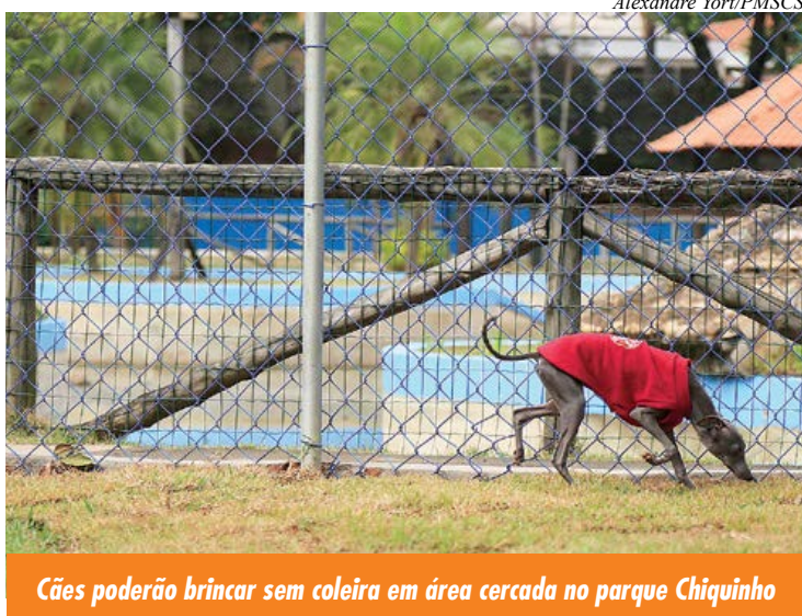
Cães poderão brincar sem coleira em área cercada no parque Chiquinho

São Caetano do Sul inaugura neste domingo (22/5), às 10h, o seu primeiro Espaço Canino, no Parque Catarina Scarparo D'Agostini, mais conhecido como Chiquinho (Rua Ângelo Aparecido Radim, 90, Bairro São José). Seguindo uma tendência mundial, com o apoio da Cobasi, a iniciativa inédita na cidade é um cercado para os frequentadores soltarem e brincarem com os cães de pequeno e grande portes. Em maio de 2015, a Prefeitura liberou a entrada dos pets no Chiquinho, acompanhados de seus donos, todos os dias, das 6h às 20h.