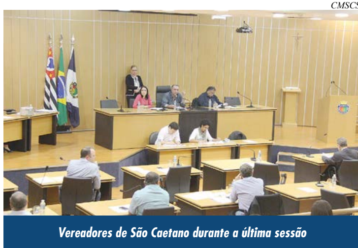
Vereadores de São Caetano durante a última sessão