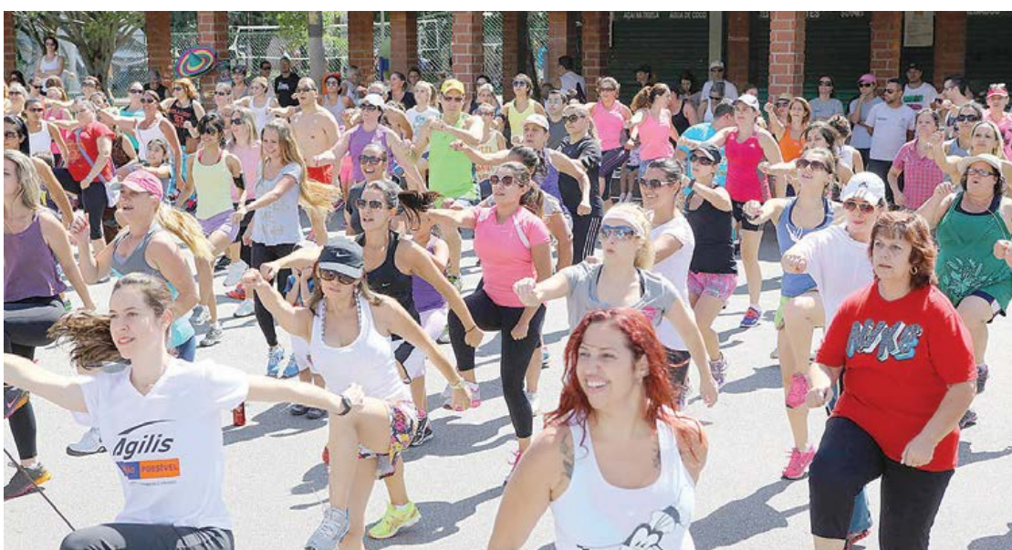
Programa Esportivo Comunitário tem hoje cerca de 11 mil inscritos em diversas atividades

No esporte, por exemplo, São Caetano, que é referência nacional e celeiro de atletas, conta com uma das iniciativas mais inclusivas e espelho para diversas cidades País afora, que é o Programa Esportivo Comunitário (PEC), que foi reformulado e ampliado na gestão Paulo Pinheiro. Página 3