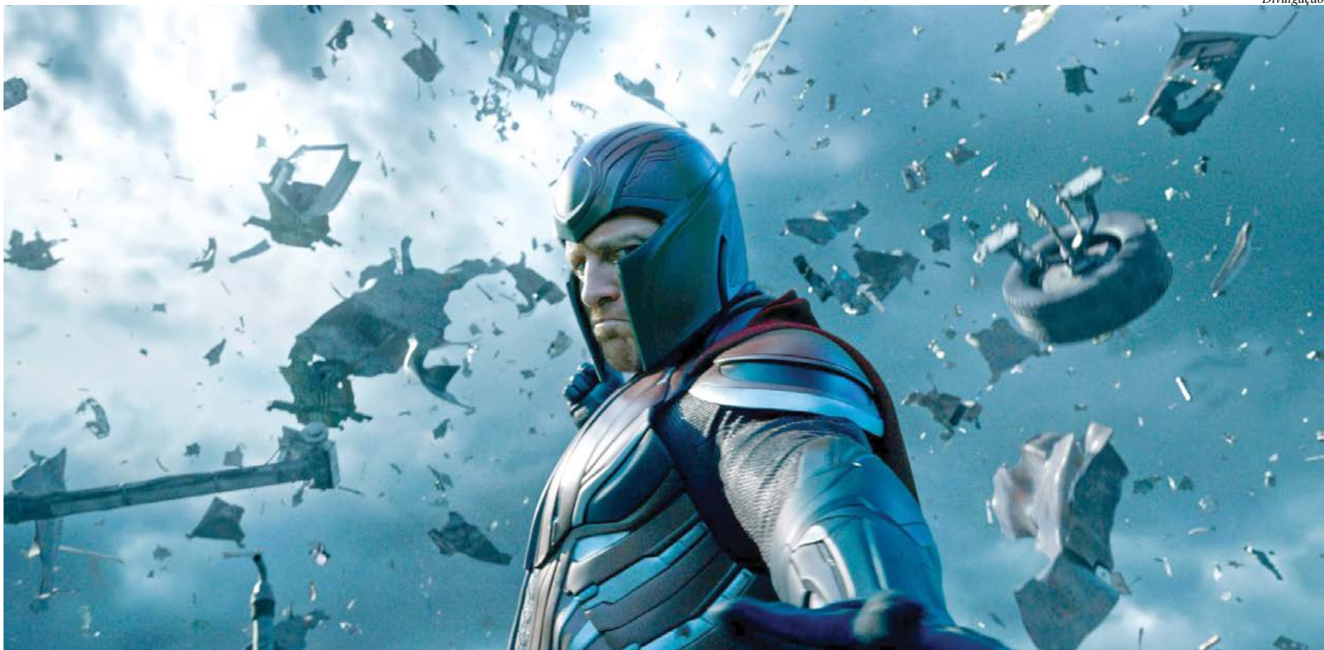
O novo filme encerra a trilogia da série X-Men

"Apocalypse" se passa uma década depois de "Dias de Um Futuro Esquecido"