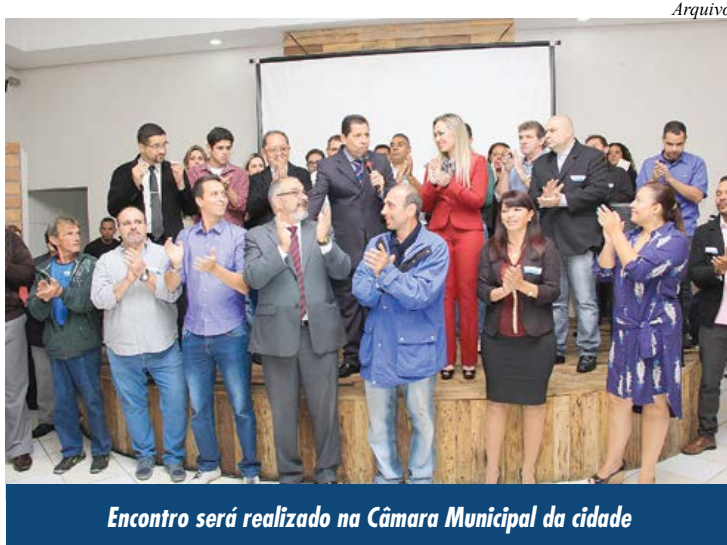
Encontro será realizado na Câmara Municipal da cidade