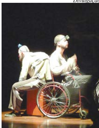
200 artistas se apresentarão

Durante o mês de julho, São Bernardo recebe a mostra de teatro 'Santo de Casa', que reúne trabalhos e pesquisas de 33 grupos do ABC, com 38 espetáculos, e que vai envolver cerca de 200 artistas. As apresentações são diversificadas e para todos os gostos: peças, rodas de conversa, palestras e intervenções artísticas. Todas acontecem no Teatro Elis Regina - Avenida João Firmino, 900, no Bairro Assunção. Mais de 2,4 mil pessoas passaram pelas catracas da primeira edição, realizada ano passado.