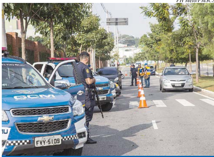
Avenida Nelson Braido tem grande circulação em horário de pico

Trabalhando para melhorar cada vez mais a segurança no trânsito, a Prefeitura de São Caetano realizou uma blitz na Avenida Nelson Braido, ao lado do Espaço Cerâmica, para fiscalizar veículos e motos irregulares, na tarde da última sexta-feira (24/6). A ação foi realizada pela Secretaria Municipal de Mobilidade Urbana em conjunto com a Guarda Civil Municipal.