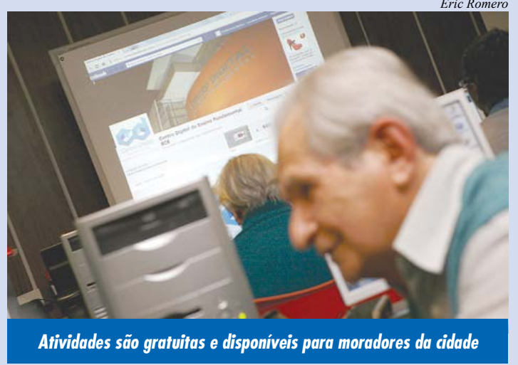
Atividades são gratuitas e disponíveis para moradores da cidade

As inscrições podem ser realizadas pelo site www.cdscs.com.br ou na secretaria do Centro Digital (Avenida Goiás, 950), de segunda a sexta-feira, das 8h às 17h.