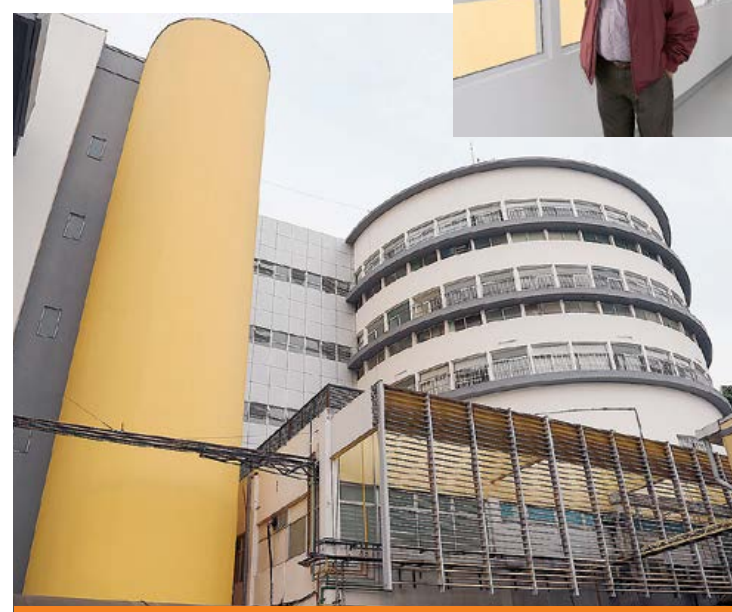
Prefeito durante vistoria das obras

Entre outras benfeitorias, foram criados dois novos leitos, três consultórios e mais uma sala de isolamento - os antigos foram reformados. Os trabalhos ainda incluíram a renovação do sistema de ar-condicionado, pintura de todas as paredes, troca do piso, revisão elétrica e instalação de forro de gesso, além da instalação de geradores que multiplicaram por quatro a capacidade de geração de energia do hospital em caso de interrupção do fornecimento.