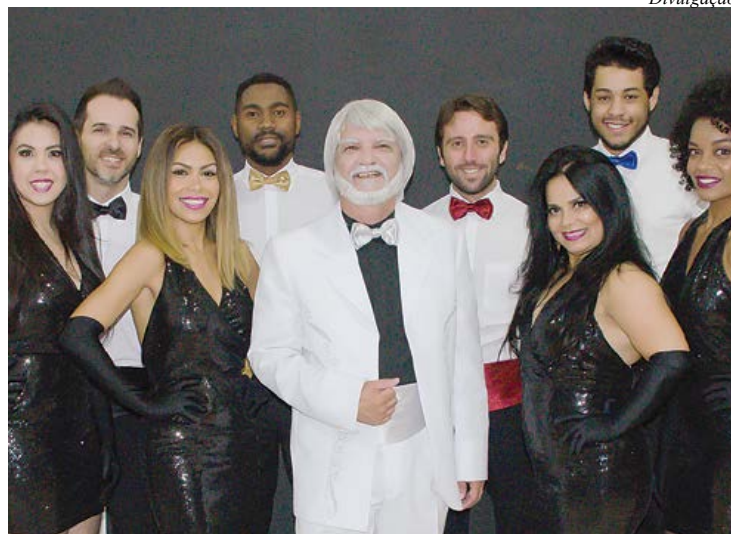
No domingo tem apresentação de Ray Conniff The Tribute