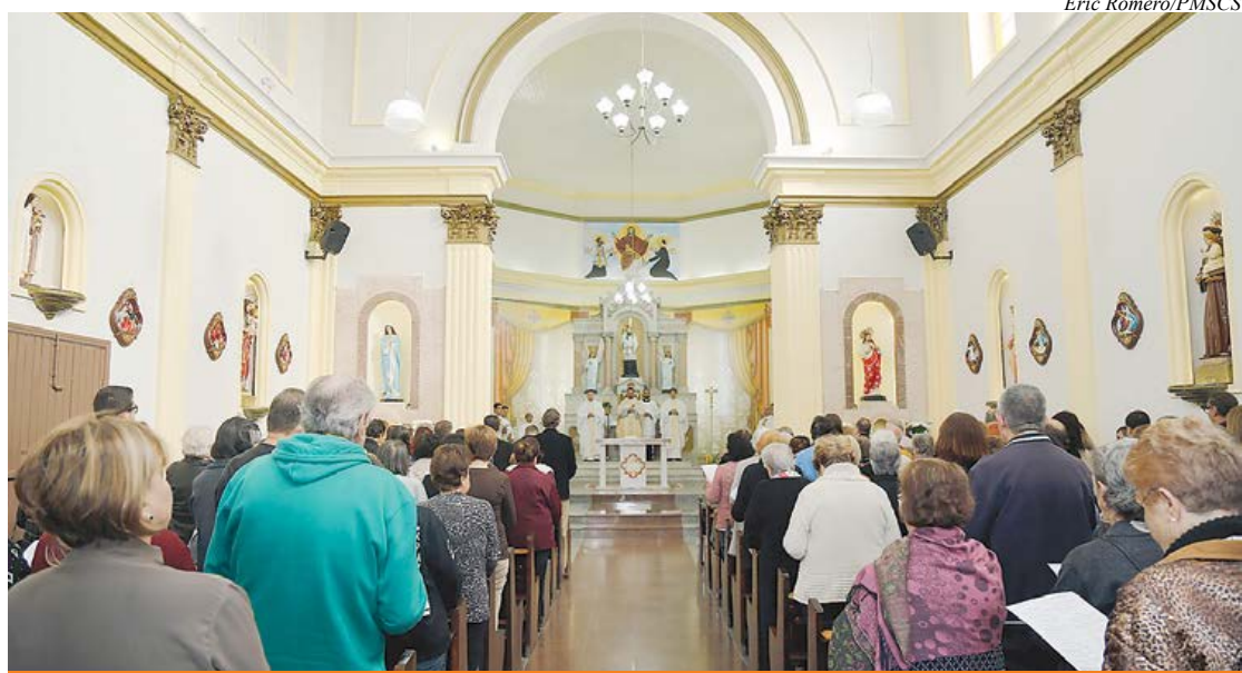
Igreja foi totalmente reformada mantendo as características originais

A igreja mais antiga de São Caetano do Sul, a Paróquia São Caetano, que fica na Praça Comendador Ermelino Matarazzo (Bairro Fundação),