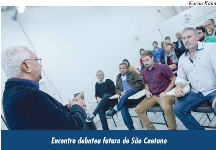
Encontro debateu futuro de São Caetano