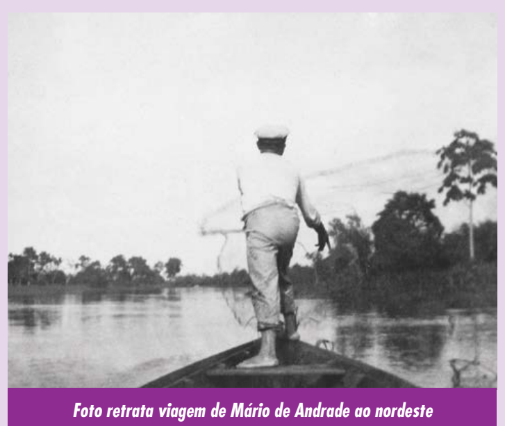
Foto retrata viagem de Mário de Andrade ao nordeste

ficar cada imagem com títulos e legendas que as expliquem ou esclareçam, Mário de Andrade alia a ação do turista-etnógrafo à do fotógrafo-poeta. Na Galeria, esses títulos e legendas são apresentados em etiquetas identificatórias, conforme as inscrições do modernista no verso das ampliações originais, incluindo linhas poéticas e anotações sobre local, data e dados técnicos da captura da imagem. O Sesc Santo André fica na Rua Tamarutaca, 302 - Vila Guiomar - Santo André. Mais informações pelo telefone: 4469-1200.