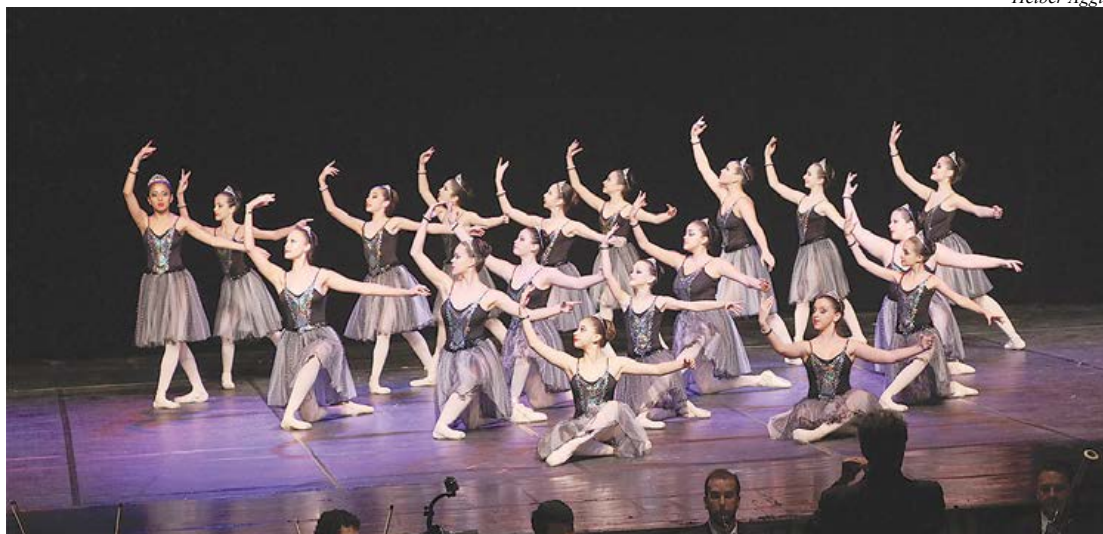
Mai de 400 bailarinos se apresentarão no evento

A Secretaria de Cultura da Prefeitura de São Caetano realiza a Mostra Livre de Dança 2016, que contará com a participação de 15 escolas, grupos e academias de dança, além de 400 bailarinos e 77 coreografias. O espetáculo será apresentado no Teatro Paulo Machado de Carvalho (Alameda Conde de Porto Alegre, 840), na sexta-feira (1/7), a partir das 20h e no sábado e domingo (2 e 3/7), às 19h. A classificação do evento é livre com entrada gratuita.