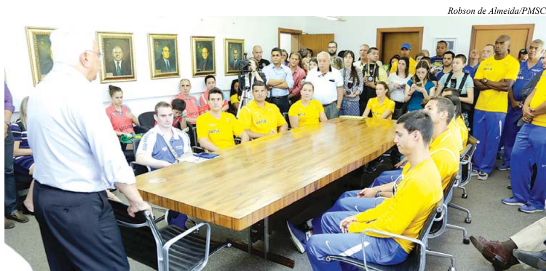
Atletas representaram o Brasil em cinco modalidades diferentes

O Palácio da Cerâmica, sede do poder Executivo, sentiu na manhã de segunda-feira (29/8) um gostinho do que foram os Jogos Olímpicos do Rio de Janeiro que aconteceram em agosto. Em evento realizado no local, a Prefeitura de São Caetano homenageou os 29 atletas da cidade que participaram das Olimpíadas representando o Brasil em cinco modalidades (Atletismo, Handebol, Ginástica Artística, Taekwondo e Tênis de Mesa). “Esporte para nós é mais