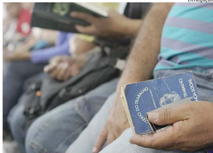
Números são da Pesquisa de Emprego e Desemprego do Dieese

O índice de desemprego no ABC registrou relativa estabilidade em julho, pelo segundo mês seguido, passando de 16,9% para 16,8%. Na análise por setores, a Indústria de Transformação foi o destaque, com geração de 10 mil postos de trabalho. Os números constam da Pesquisa de Emprego e Desemprego (PED), realizada pela Fundação Seade e pelo Dieese, em parceria com o Consórcio Intermunicipal Grande ABC, divulgada quarta-feira (31) na sede da entidade.