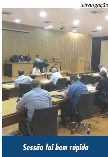
Sessão foi bem rápida