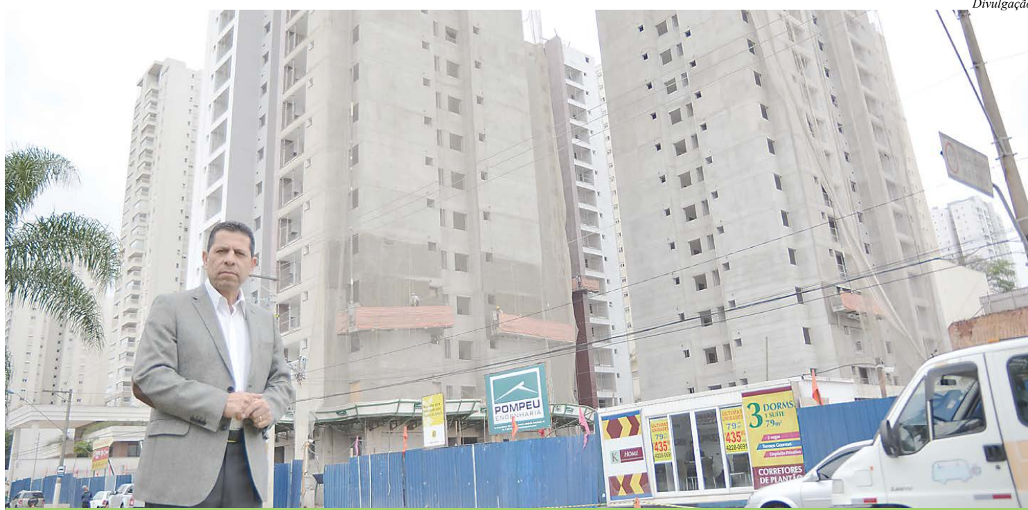
Gilberto Costa criticou o excesso de prédios levantados durante a gestão anterior

A construção de muitos prédios gerou um aumento excessi-