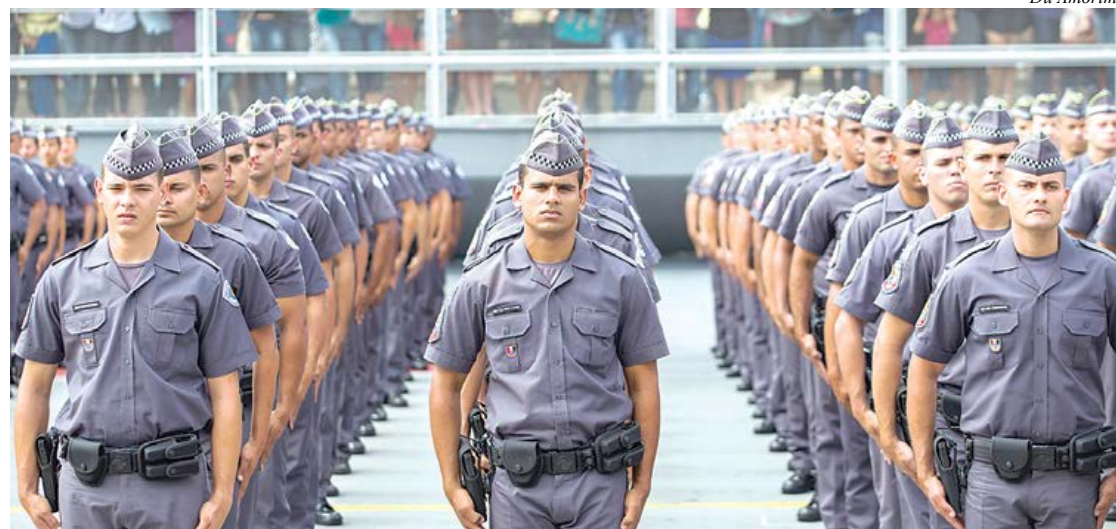
Concurso é para preenchimento de 5,4 mil vagas para soldado de segunda classe

O governador Geraldo Alckmin autorizou a abertura de concurso para preenchimento de 5,4 mil vagas para soldado de 2ª Classe da Polícia Militar do Estado de São Paulo. A remuneração inicial para o cargo é de R$ 2.357,76, além do adicional de insalubridade de R$ 571,51. O provimento do efetivo deverá ocorrer em duas etapas, maio e novembro de 2017.