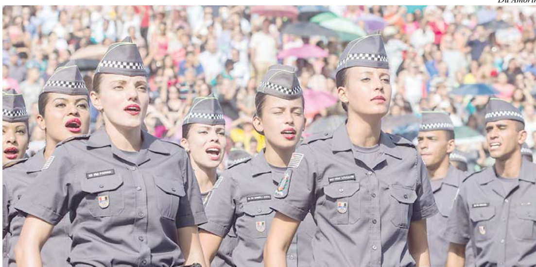
Concurso é para preenchimento de 5,4 mil vagas para soldado de segunda classe

O governador Geraldo Alckmin autorizou a abertura de concurso para preenchimento de 5,4 mil vagas para soldado