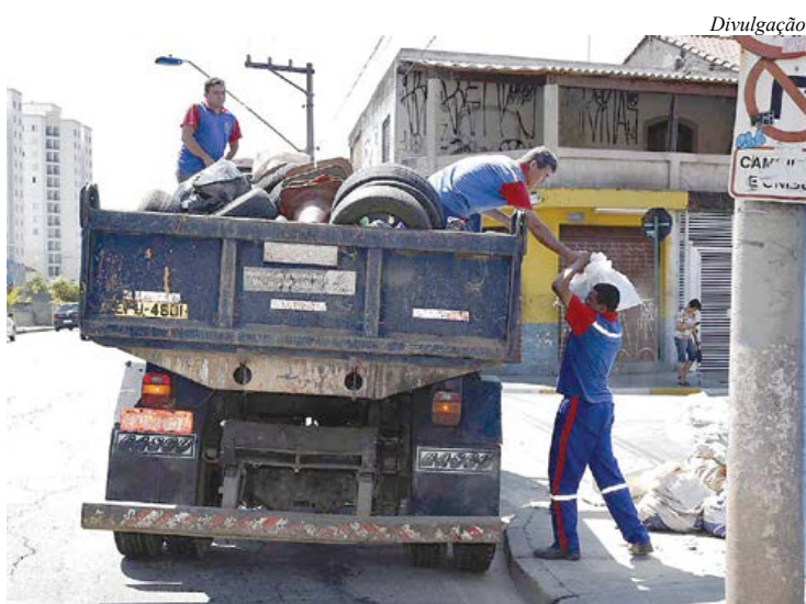
Caminhões de descarte passarão em toda cidade

A Prefeitura Municipal de São Caetano do Sul por meio da Secretaria Municipal de Serviços Urbanos percorrerá até o dia 30/9 todos os bairros do município para recolher objetos descartados pela população, como parte da Operação Cata-treco. Nesta semana, o Cata-Treco percorreu o Bairro Prosperidade, o Bairro Fundação e a região central da cidade. Os veículos da Prefeitura estarão nos bairros das 8h às 16h. Mais informações podem ser