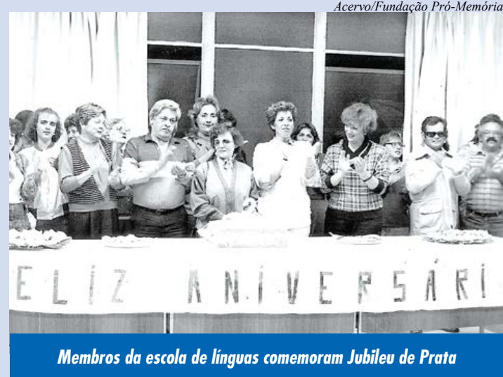
Membros da escola de línguas comemoram Jubileu de Prata

A partir de fotos do Centro de Documentação Histórica e da própria Escola de Idiomas, a mostra virtual tem o objetivo de abordar não só o aspecto histórico, mas também registrar seu crescimento, e sua atuação enquanto instituição educacional, social, profissional e cultural. Informações pelo telefone 4223-4780.