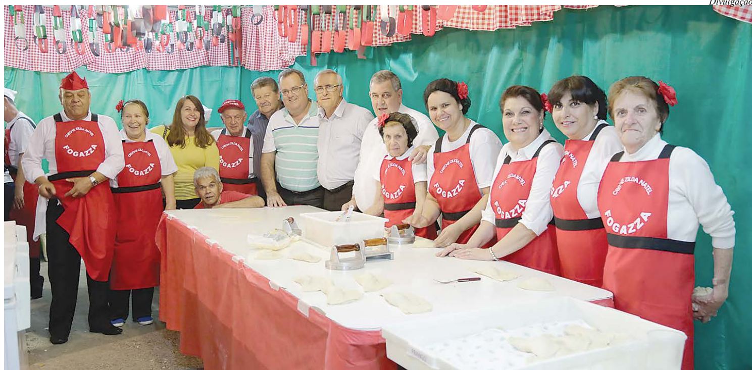
Barraca da Creche Zilda Natel serviu a tradicional focazza

O chefe do Executivo apresentou o diplomata com uma miniatura do santo São Caeta-