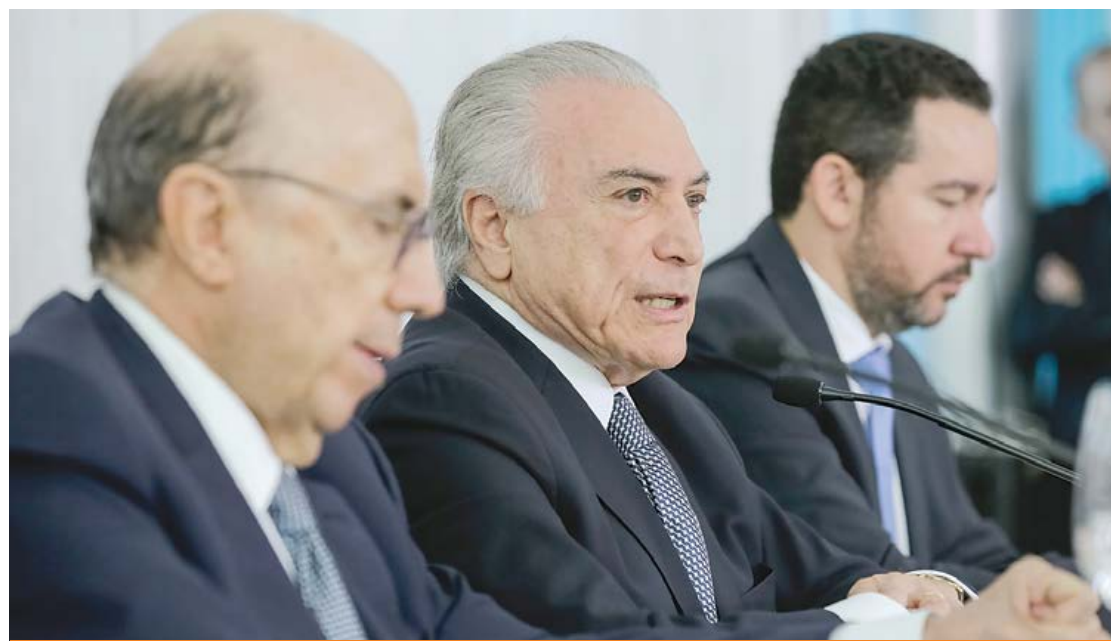
Intenção do governo com a proposta é de injetar cerca de R$ 30 bilhões na economia

O presidente da República, Michel Temer, anunciou quinta-feira (22) a liberação de saques de contas inativas do Fundo de Garantia por Tempo de Serviço (FGTS) e a redução nos juros do cartão de crédito. Com as medidas, o governo espera aquecer a economia brasileira.