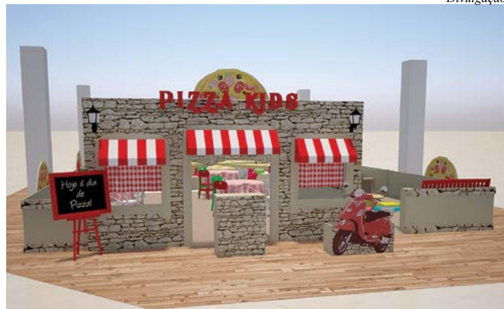
Cenário lembra pizzaria tradicional

Os mestres-cucas mirins já têm diversão garantida durante as férias de janeiro no ParkShoppingSãoCaetano. Entre 6 e 29 de janeiro de 2017, o evento Pizza Kids receberá gratuitamente crianças de 4 a 12 anos para um momento gastronômico.