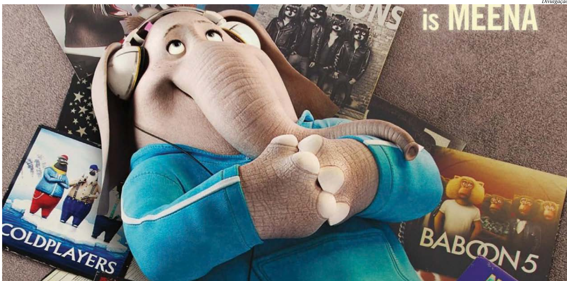
A personagem Meena precisa vencer a timidez pra conquistar a todos com sua voz

Filme repete a fórmula de programas como American Idol e The Voice