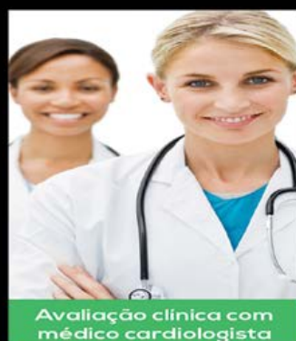
Avaliação clínica com médico cardiologista

FOCO NAS SUAS METAS COM SAÚDE E SEGURANÇA