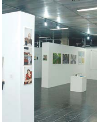
Salão de Arte Contemporânea

As inscrições para o Salão de Arte Contemporânea Luiz Sacilotto estão abertas. Artistas interessados em participar podem se inscrever até 3 de fevereiro de 2017. Um dos mais tradicionais em todo o Brasil, o salão destina-se a reunir trabalhos nacionais das artes plásticas contemporâneas.