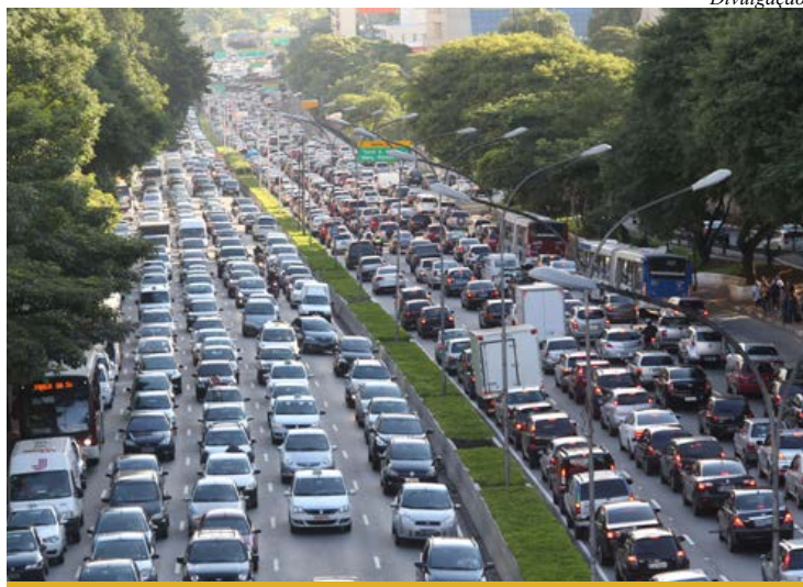
Reta final: últimos dias para licenciamento obrigatório

O licenciamento do exercício 2016 entrou na reta final. Todo veículo, independentemente do número final de placa, estará irregular se circular a partir de 1º de janeiro de 2017 sem o licenciamento deste ano e poderá ser guinchado e removido a um pátio.