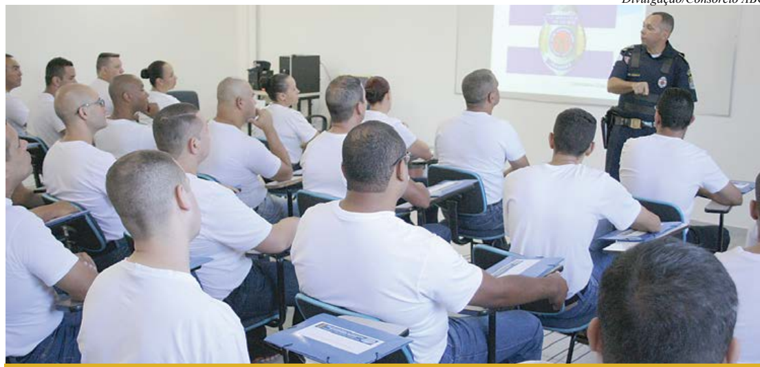
Unidade oferece cursos de formação continuada

O Centro Regional de Formação em Segurança Urbana (CRFSU), mantido pelo Consórcio Intermunicipal Grande ABC, qualificou 1.073 guardas civis municipais da região em seu primeiro ano de atividade. Inaugurada oficialmente em 14 de dezembro de 2015, a unidade, localizada em São Bernardo do Campo, oferece cursos de ingresso na corporação, formação continuada, ascensão na carreira e especialização.