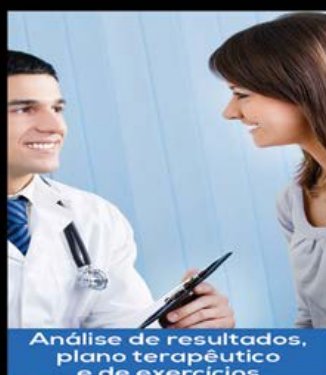
Análise de resultados, plano terapêutico e de exercícios