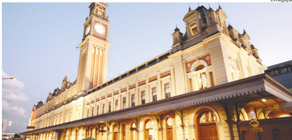
Museu foi atingido por incêndio em dezembro de 2015

O governador Geraldo Alckmin anunciou uma aliança solidária para reconstrução do Museu da Língua Portuguesa, atingido por um incêndio em dezembro de 2015. A EDP é patrocinadora máster. Grupo Itaú e o Grupo Globo são patrocinadores do Museu, que conta ainda com apoio da lei federal de incentivo à Cultura.