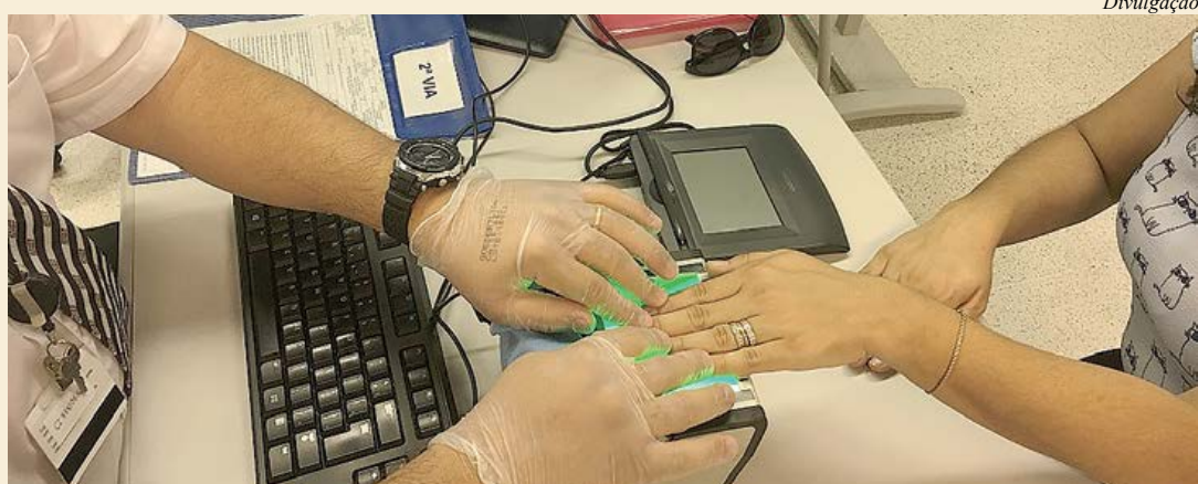
Cidadão não precisa mais levar foto para tirar o RG

O Poupatempo São Bernardo do Campo está localizado na Rua Nicolau Filizola, 100 - Centro. O horário de funcionamento é de segunda a sexta-feira, das 7h às 19h, e aos sábados, das 7h às 13h.