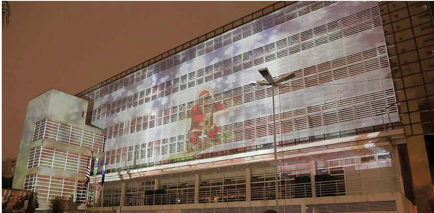
Projeção na fachada da Câmara Municipal recebe muitos visitantes diariamente