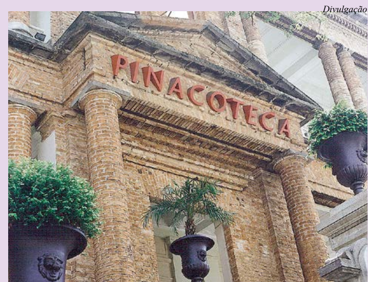
Pinacoteca conta com visitas guiadas

Museu do Café - Para quem deseja curtir um passeio em família no litoral, o Museu do Café, em Santos, tem uma programação diversificada com atividades para crianças a partir de 3 anos de idade. www.museudocafe.com.br