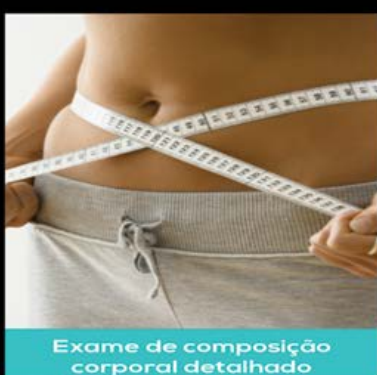
Exame de composição corporal detalhado