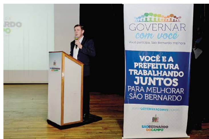
Prefeito Orlando Morando

Em seu terceiro ano de atividades, o programa Governar com Você, elaborado pela Prefeitura de São Bernardo, colheu 25 mil sugestões da população, que ajudarão na elaboração do Orçamento de 2020. A coleta de informações teve início no começo de fevereiro e terminou em 30 de março. Página 8