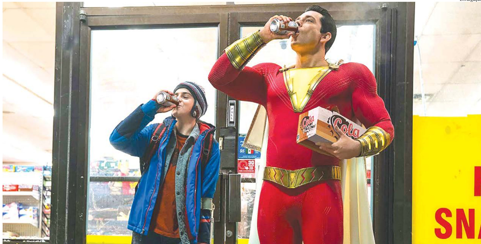
Freddy Freeman e Shazam vivem situações divertidas