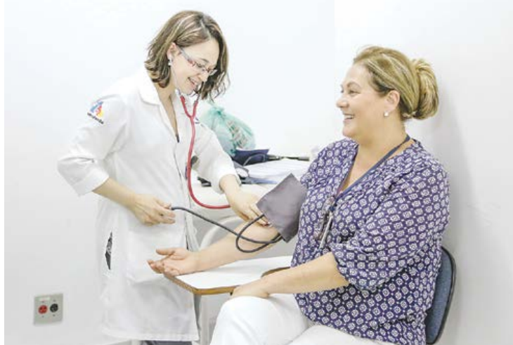
Plenária Municipal de Saúde será realizada no dia 10 de abril

Integralidade, equidade e universalidade. Para assegurar estes três princípios doutrinários do SUS (Sistema Único de Saúde) é fundamental a participação popular. Por isso, a Prefeitura de São Caetano do Sul convida todos os moradores a comparecerem à Plenária Municipal de Saúde, que será realizada quarta-feira (10/4), às 18h, no auditório do Hospital São Caetano (Rua Espírito Santo, 277, Bairro Santo Antônio).