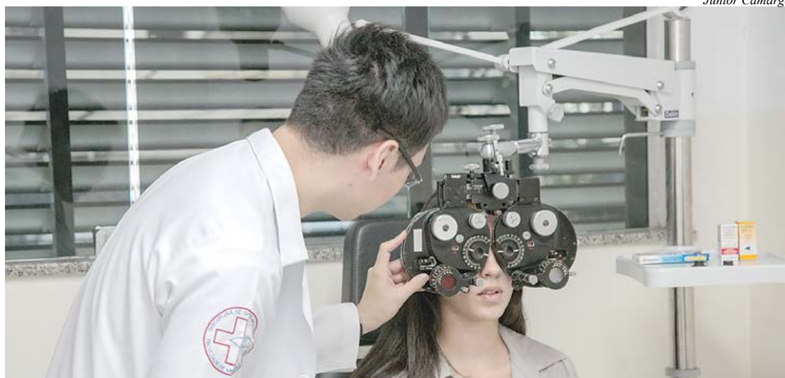
Na cidade, são cerca de 3.150 atendimentos por mês, entre consultas, exames e procedimentos cirúrgicos

Os serviços oftalmológicos da rede municipal de saúde de São Caetano do Sul são referência para o Brasil. E no Abril Marrom, que alerta para a Prevenção e o Combate à Cegueira, a Prefeitura reforça a importância de os moradores se consultarem com um médico oftalmologista. Usuários da rede e portadores do CidCard têm à disposição um trabalho de excelência prestado na Unidade de Saúde Oftalmológica Dr. Jaime Tavares (Rua Peri, 361, Bairro Santa Paula).