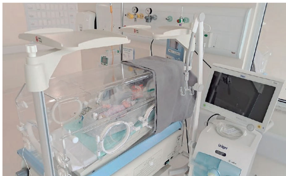
Zero mortalidade materna e destaque estadual: Hospital da Mulher é símbolo