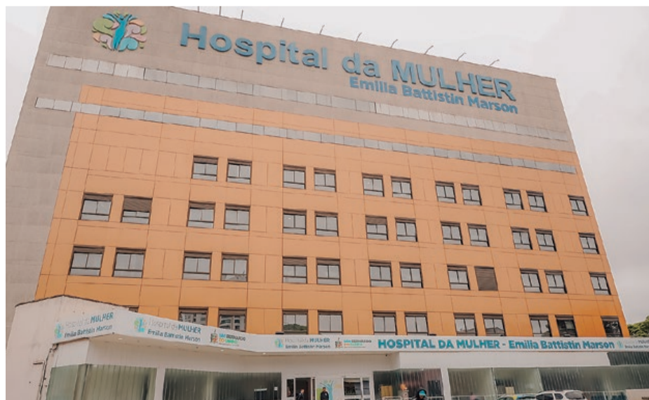
Com excelência e humanização, Hospital da Mulher está entre os melhores do Estado