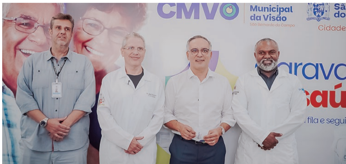
Com gestão e planejamento, a Prefeitura de São Bernardo avança na saúde

CARAVANA DA SAÚDE - Criada em janeiro de 2025, a Caravana da Saúde se consolidou como uma das principais marcas da gestão Marcelo Lima, com mais de 250 mil atendimentos realizados no último