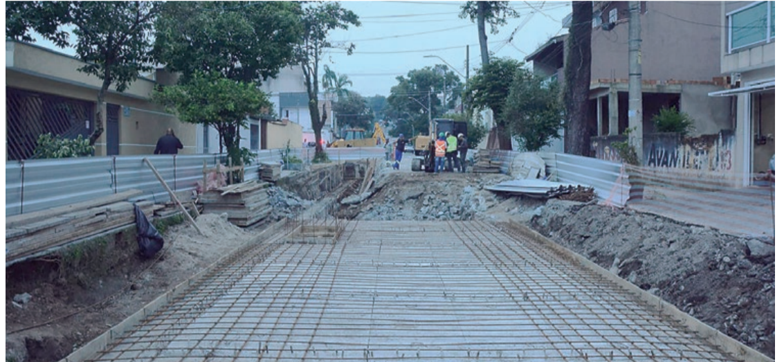
Planejamento visa projetar e gerenciar a gestão das águas pluviais do município

"O último plano foi de 1996 e colocado em prática em 1999. Tivemos obras, atualizações, e agora vamos dar continuidade. São intervenções estruturantes e esse planejamento vai fazer com que a política urbana de pequeno, médio e longo prazo, aloque da melhor forma os recursos, obtendo uma cidade mais resiliente", comentou o prefeito Gilvan Ferreira.