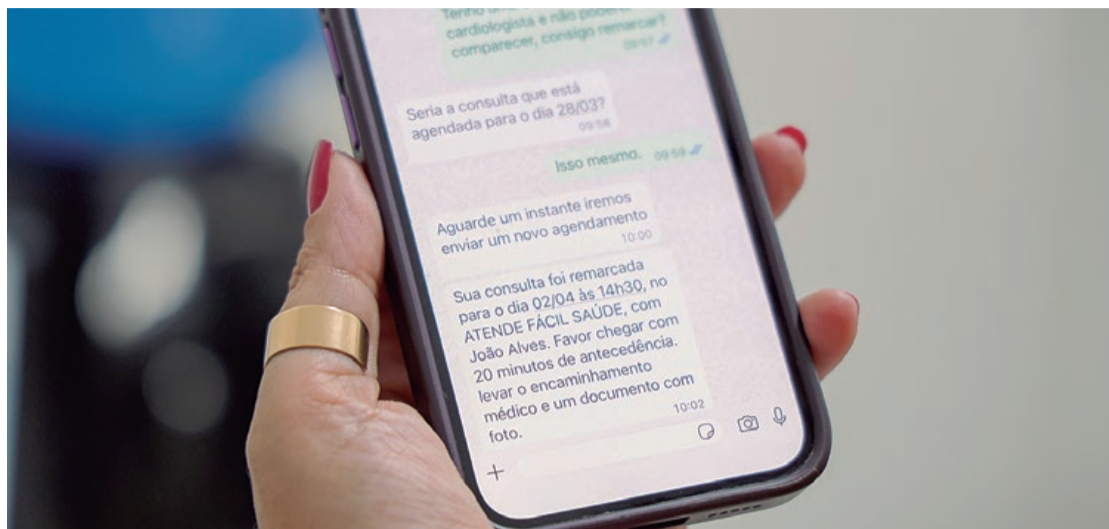
Novo recurso facilita o reagendamento de atendimentos na rede municipal de saúde

“Quando a Saúde Conectada foi implantada ela só dava duas opções: confirmar ou cancelar o agendamento.