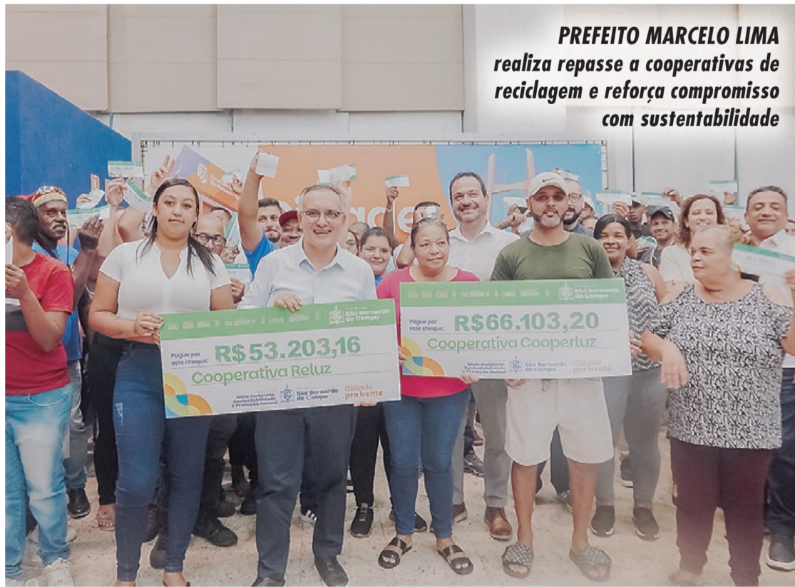
PREFEITO MARCELO LIMA realiza repasse a cooperativas de reciclagem e reforça compromisso com sustentabilidade

BALANÇO - Somados os repasses feitos pela Prefeitura nos últimos 12 meses (março de 2025 a fevereiro de 2026), o total destinado às cooperativas para o pagamento dos trabalhadores chega a R$ 1.269.818,00. Os valores se referem aos recursos que a administração economizou com as 641 toneladas de material reciclável que deixaram de ser enviadas ao aterro sanitário que recebe o lixo produzido em São Bernardo.