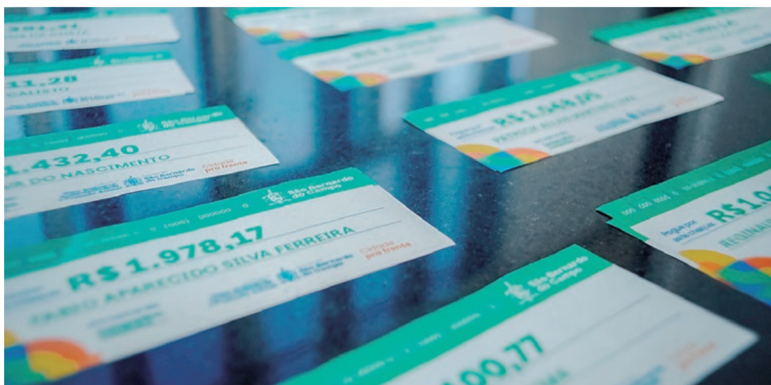
Quantidade ampliada endeu repasse de pouco mais de R$ 119 mil às instituições

APROVEITAMENTO - Apesar da queda no volume de material recebido pelas cooperativas em fevereiro (895 toneladas), na com-