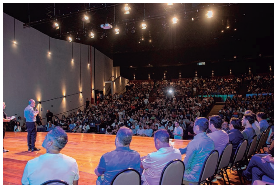
Prefeito Tite Campanella apresenta balanço em evento com mais de mil pessoas