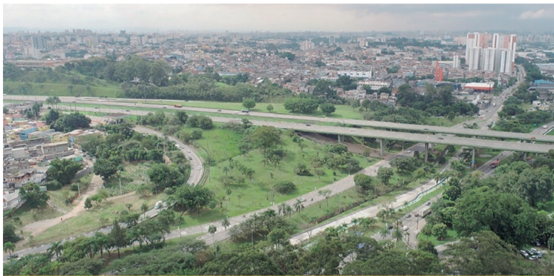
A regularização foi resultado de um processo gradual de reestruturação e negociação

O CRP é um certificado oficial emitido pelo Governo Federal, que atesta que o Regime Próprio de Previdência Social (RPPS) cumpre os requisitos legais, contábeis, atuariais e administrativos previstos na legislação. Sua emissão é realizada por meio