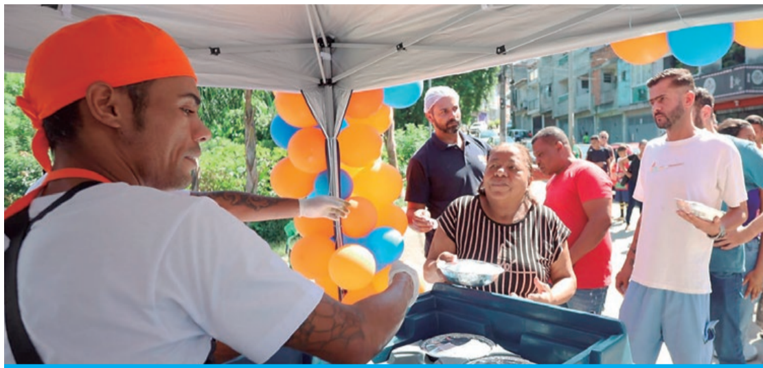
A nova unidade fortalece a política de segurança alimentar no município