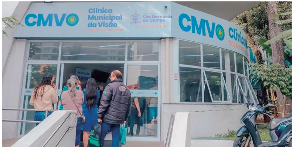
Unidade de saúde registra quase 5 mil consultas no período de quase dois meses

No período, a unidade municipal de saúde contabilizou 759 procedimentos oftalmológicos, incluindo 217 aplicações de injeção intravítrea, 73 fotocoagulações e 57 intervenções com YAG laser (não invasivo). A ampliação da oferta se reflete na área diagnóstica, com 3.196 exames realizados, entre eles 1.800 protocolos de glaucoma, 659 mapeamentos de retina e 402 protocolos de catarata.