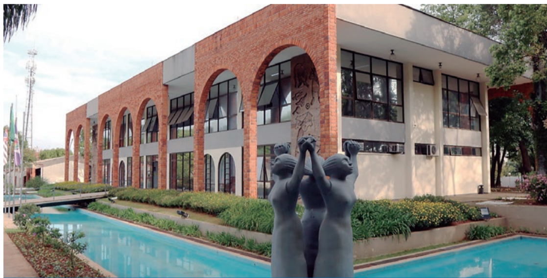
O sistema da Prefeitura será base para diversos serviços e programas públicos

As próximas fases contemplarão estudantes da rede municipal e, posteriormente, todos os moradores da cidade. A Prefeitura reforça que os munícipes inseridos nas fases atualmente abertas podem continuar realizando o cadastro normalmente pelo portal oficial do SancaGov.