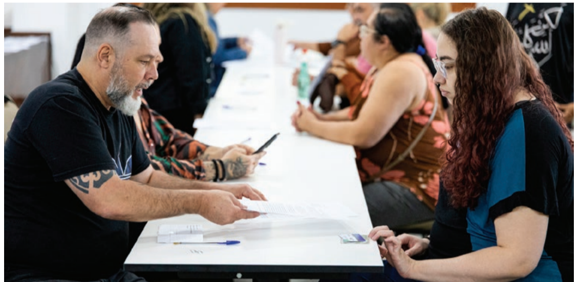
Aproximadamente 41 mil moradores já realizaram seus cadastros no Sancagov